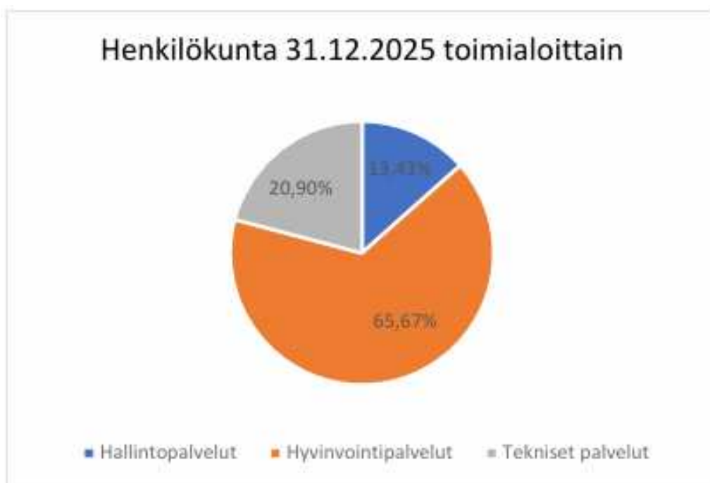
Kuva 1: Henkilökunta 31.12.2025 toimialoittain